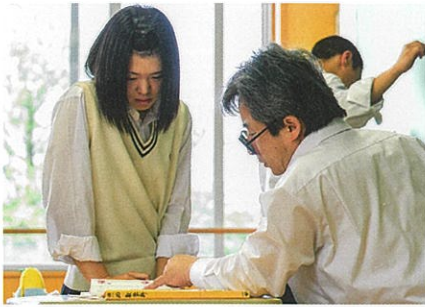
平成30年度 難関国公立大学合格者

*平成30年度の主な国公立大学、私立大学合格者数。 《 》は過去5年、( )は浪人内数。