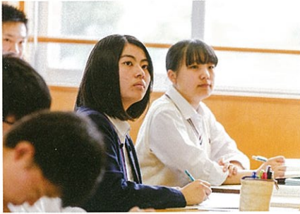
平成31年度 難関国公立大学合格者

*平成31年度の主な国公立大学、私立大学合格者数。 < >は過去5年、( )は浪人内数。